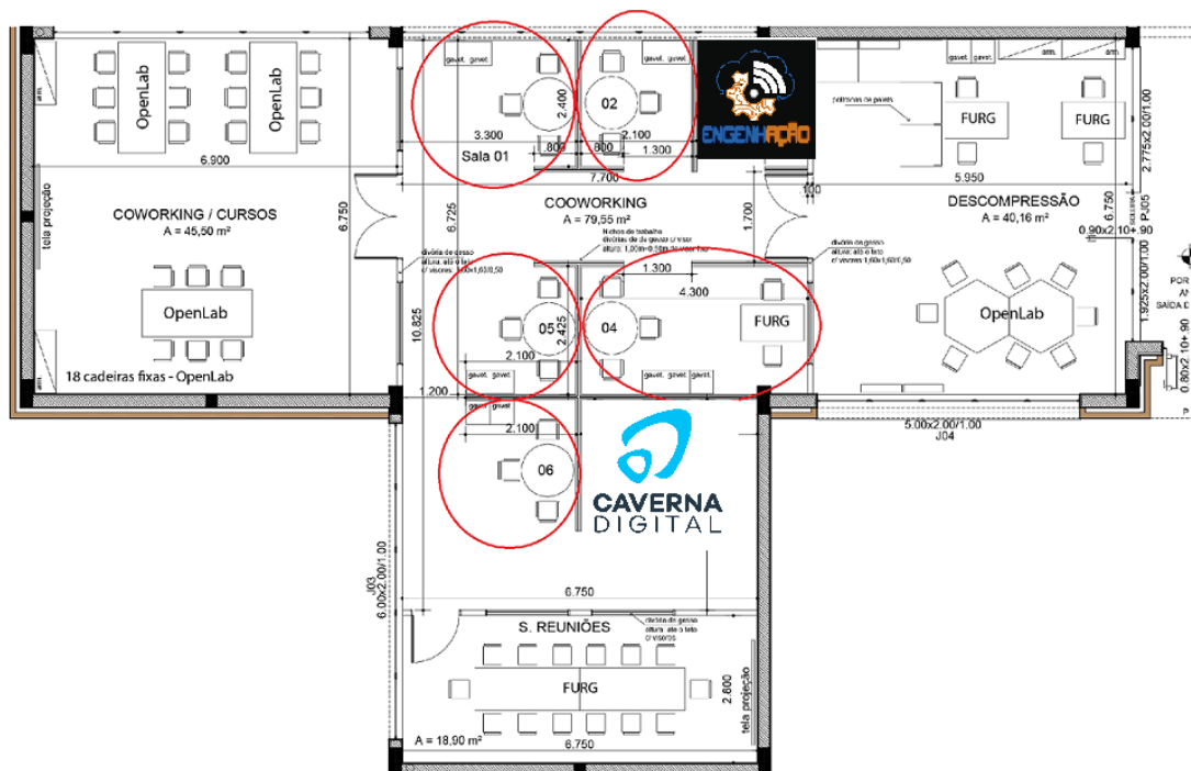
Figura 2. Planta do prédio da Innovatio 2.

O prédio 2 da INNOVATIO está situado dentro do prédio do OCEANTEC – Parque Científico e Tecnológico da FURG e possui 5 (cinco) nichos de trabalho individualizados disponíveis, em sistema de coworking com paredes/divisórias de 1,5 m.